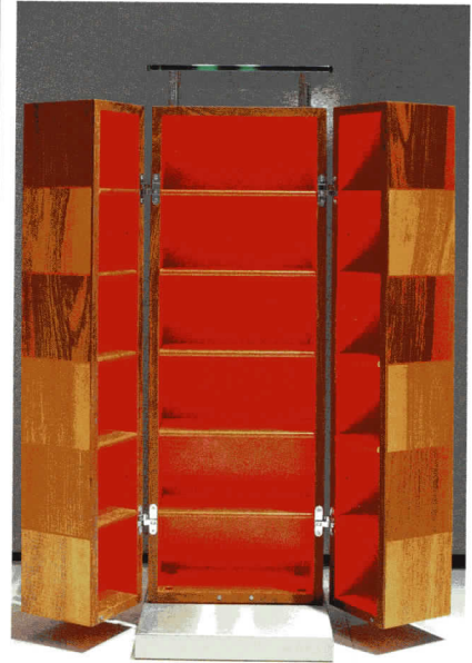
Schränkchen und Tisch werden individuell in der gewünschten Holzart gefertigt.