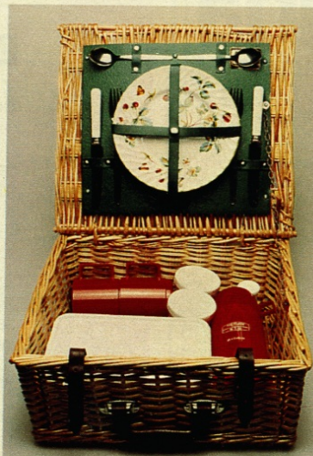
Die Anschriften der Hersteller und Lieferanten stehen auf Seite 129