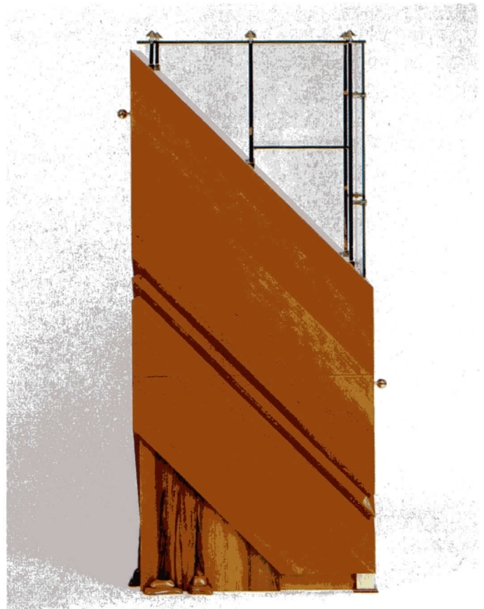
Art Incrusta-Möbel der Firma Zuchi werden individuell und nach Maß auf

denen Schriftzeichen fanden auf keiner noch so großen Tastatur Platz. Der Fax (abgeleitet aus dem Lateinischen "facsimile" = mache ähnlich) tastet die Papieroberfläche wie ein Kopierer auf Kontraste ab, zerlegt diese Information in Impulse und übermittelt sie über das Telefonnetz. Das Empfangsgerät setzt die Information wieder entsprechend zusammen und wirft die so erstellte "Kopie" aus. Angeblich haben diese kleinen Wundermaschinen in Amerika den handgeschriebenen Liebesbrief wieder zum Leben erweckt, denn der kann genauso innerhalb weniger Sekunden an den Partner oder die Partnerin übermittelt werden (vorausgesetzt er/sie hat seinen/ihren Fax in Griffweite.) Das ist aber heute auch kein Problem mehr, da es schon tragbare Faxgeräte gibt, die über das Autotelefon oder auch über jede Telefonzelle zum Einsatz kommen können. Auch gibt es österreichweit schon einige hundert Postämter, die Ihr Fax gerne an die gewünschte Zieladresse übermitteln. Die kleinsten Ausführungen gibt es übrigens mittlerweile schon um rund 10.000,- Schilling und Sie können es abwechselnd mit Ihrem Telefon über die bestehende Leitung verwenden. Wer's einmal hat, kann ohne wirklich nicht mehr sein!