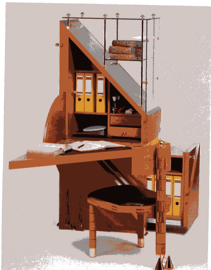
die Bedürfnisse des Kunden abgestimmt. (Quellennachweis: rechts unten.)

während der Freizeit aus dem Blickfeld und damit aus dem Gedächtnis zu verdrängen ist es empfehlenswert, das Heimbüro mit Rolladenschränken anstelle von offenen Regalen auszustatten. Solche Schränke bieten viele Unterbringungs- und Ablegemöglichkeiten, sie können im Gegensatz zu normalen Schränken während des ganzen Arbeitstages offen bleiben, ohne daß Türen störend in den Raum stehen.