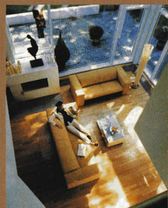
Coverphoto: Rolf Benz