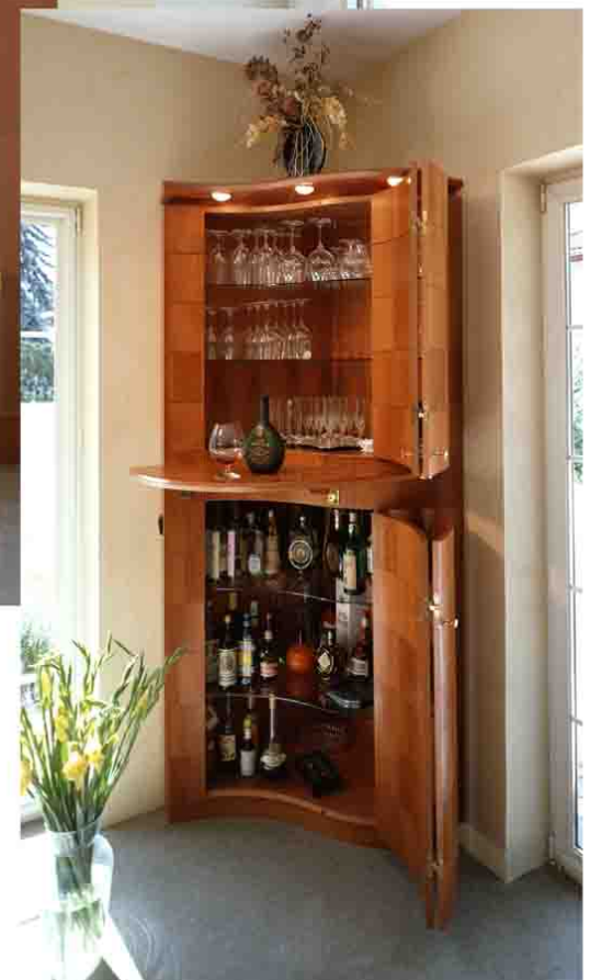
Eckbar mit Pult B 88, T 100, H 210 Entwurf: PETER ZUCHI